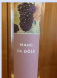
Marc de Dôle 2 cl 6.50