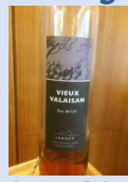
Vieux Valaisan 2 cl 6.50